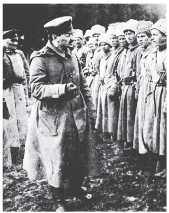
Basil Blackwell, Inc. Le Commissaire à la guerre et organisateur de l'Armée rouge s'adresse à ses soldats.

tisme » et « démocratie ». Le patriotisme signifie la défense de l'empire colonial de la France ; la « démocratie » ne signifie rien de réel, mais sert seulement à enchaîner au char de l'impérialisme les classes petites-bourgeoises.