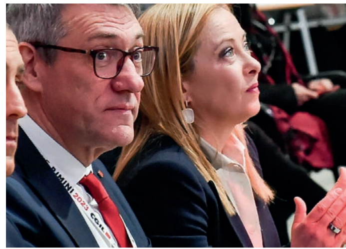
Giorgia Meloni et le secrétaire de la CGIL Maurizio Landini lors du congrès syndical à Rimini, 17 mars 2023.

Le programme de PAP et des groupes communistes qui le composent, tels que RDC et Cambiare Rotta, propose des solutions qui sont le contraire de ce