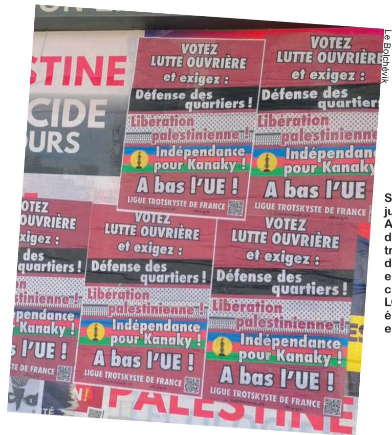
Sevrans (93), juin dernier : Affichage de la Ligue trotskyste de France en soutien critique de LO pour les élections européennes.

Surtout, pour polariser les Caldoches et les « métros » et enfoncer un coin entre eux d'un côté et le pouvoir colonial de l'autre, il faut que la classe ouvrière en France soit mobilisée pour l'indépendance. L'impérialisme français en pleine décadence est en train de détruire économiquement Kanaky, et en même temps il ne cesse de s'attaquer aux acquis des travailleurs en France,